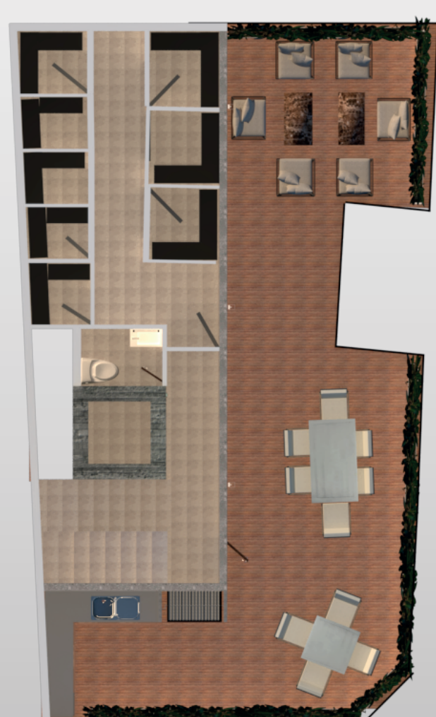
8º. Nivel Sky Garden : 93.00 M2