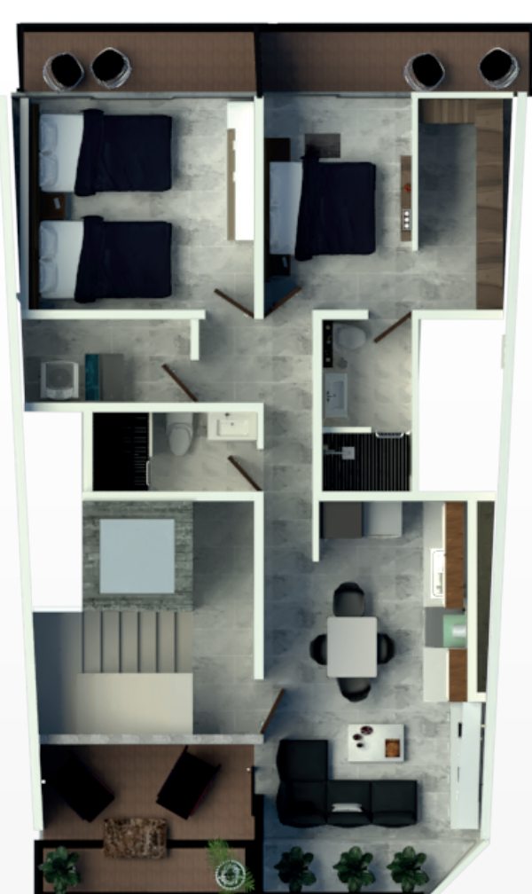
1er. - 7º Nivel Depto. "Bosco" : 100.90 M2