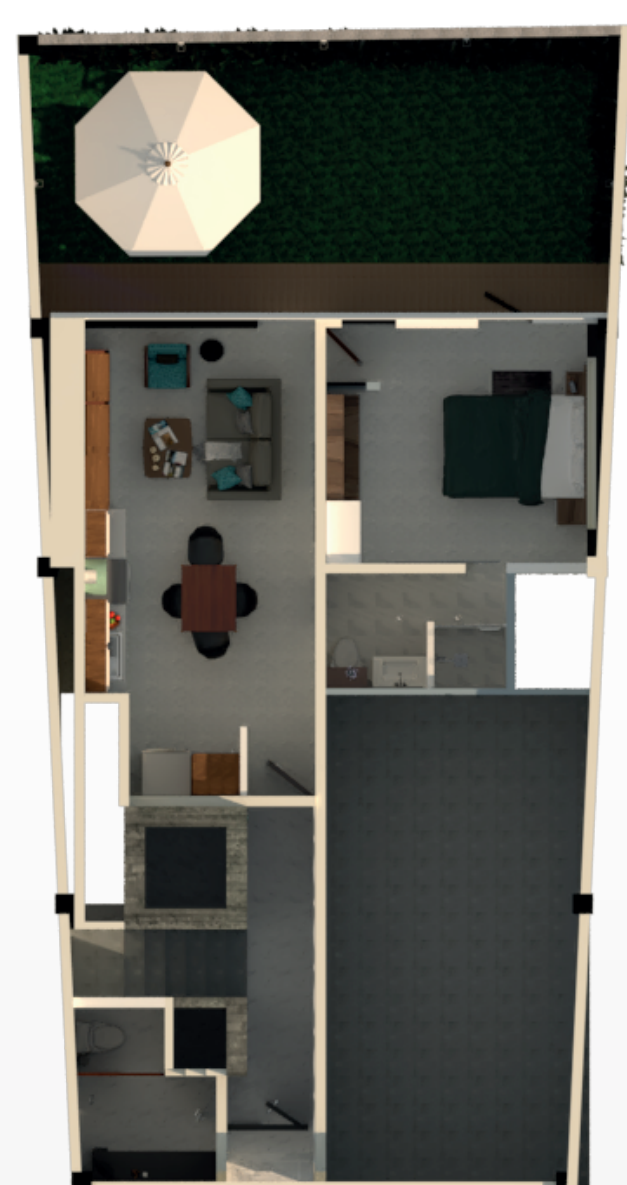
P.B. Acceso - Vigilancia - Depto. "Castell" : 90.90 M2